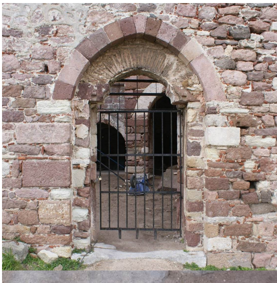
Εικ. Β9-Β10 Αυλόθυρα Οθωμανικού Ιεροδιδασκαλείου. Διατηρείται το κατώφλι από γκρίζο