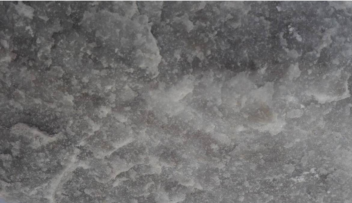
Εικ. Β2 Λεπτομέρεια επιφάνειας ακατέργαστου θραύσματος από γκρίζο μάρμαρο από το λατομείο της Πηγής Λέσβου που προσομοιάζει μακροσκοπικά με τα μάρμαρα που έχουν χρησιμοποιηθεί στο Κάστρο Μυτιλήνης.