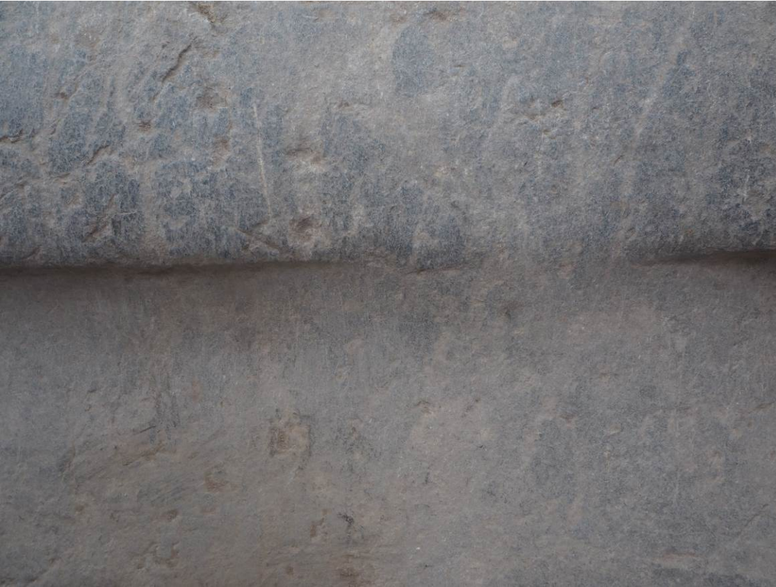
Εικ. Β7 Το κατώφλι της αυλόθυρας από κυανότεφρο μάρμαρο. Λεπτομέρεια τελικής επιφάνειας.

Εικ. Β6 Το κατώφλι της εισόδου στην αίθουσα προσευχής από λευκόφαιο μάρμαρο. Διακρίνεται η λοξότμητη απότμηση για την προσαρμογή της δεξιάς παραστάδας του πλαισίου που φέρει εντορμία ορθογωνικής διατομής (σύνδεση με μαρμάρινη παραστάδα). Εσωτερικά διακρίνεται επίσης εντορμία προσαρμογής ξύλινου κουφώματος σε επαφή με την παραστάδα.