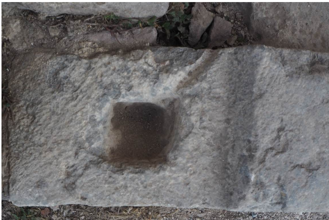
Εικ. Β8 Κατώφλι αυλόθυρας. Λοξότμητη απότμηση για την προσαρμογή της αριστερής παραστάδας του πλαισίου που φέρει εντορμία ορθογωνικής διατομής για τη σύνδεση των μελών.